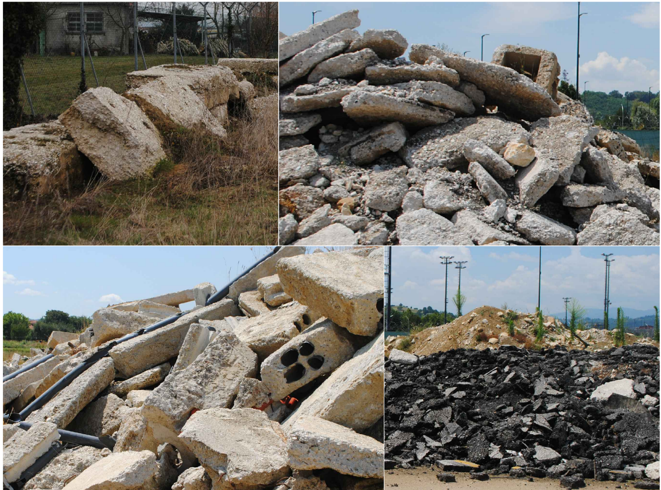
ESEMPIO DI MATERIALE PRESENTI IN CANTIERE E RIUTILIZZATI PER IL GIARDINO ARIDO LE MACERIE POTRANNO ESSERE UTILIZZATE ANCHE A SEGUITO DI LAVORAZIONE SECONDO INDICAZIONE DELLA D.L.