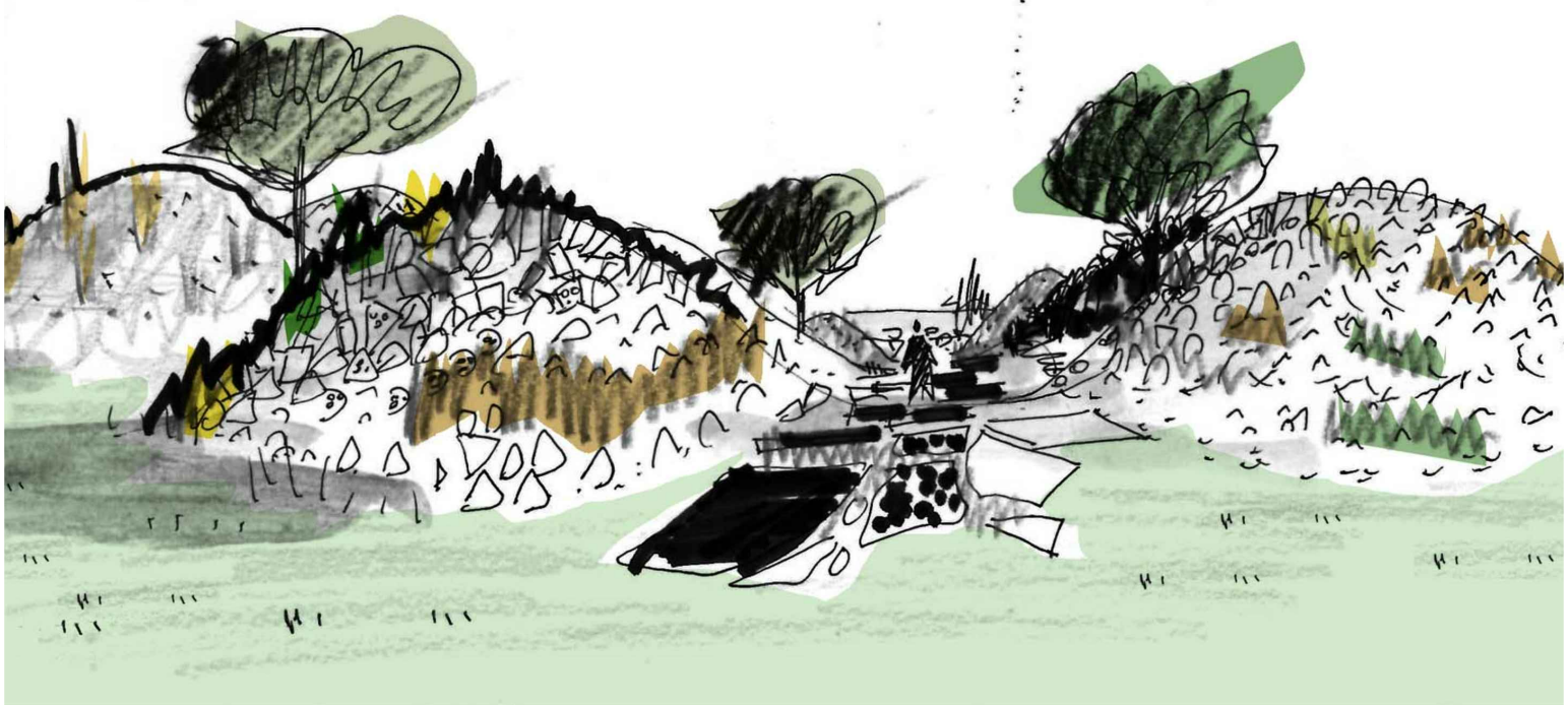
VISTA DAL PERCORSO EST-OVEST